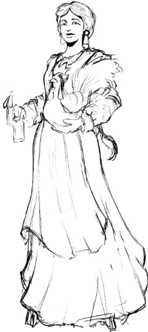
Masovera de Can Cortès